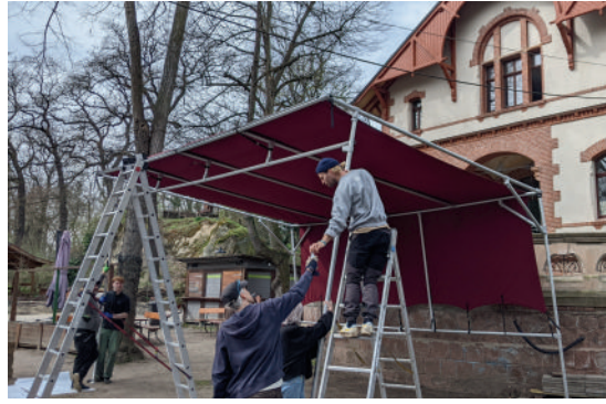
März: unser neues Bühnendach für die kleine Bühne wird aufgebaut