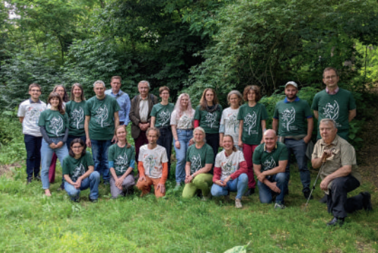
Juni: das Organisationsteam des zweiten langen Tag der Stadtnatur