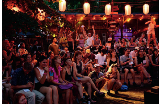
Juli: das erstes Sommerfest - unsere bisher größte Veranstaltung am Peißnitzhaus