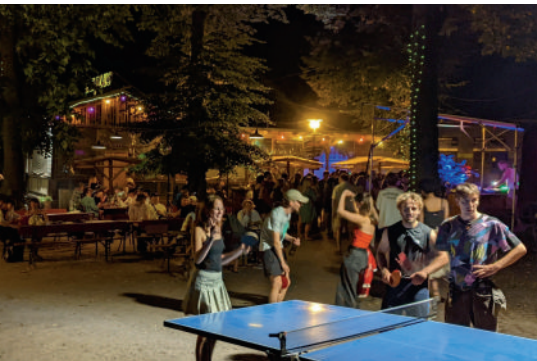
August: die sechszehnte Mittwochsphase mit dem Drehkreuz-Kollektiv