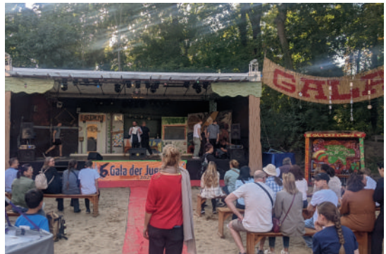
September: die "Gala der Jugend" - erstmals zu Gast auf der Insel