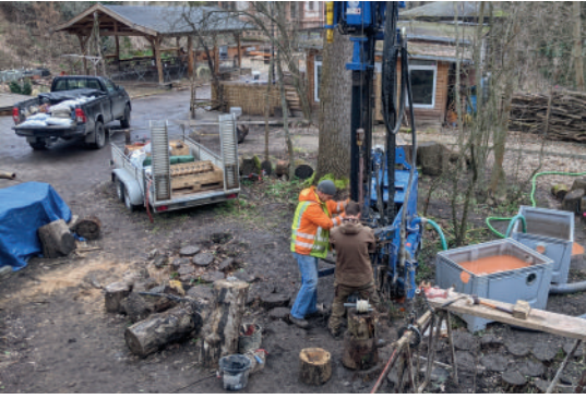
Januar: Brunnenbohrung für den Wasserspielplatz - 11 Meter tief!